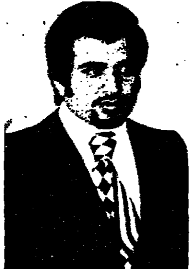
الشيخ عبد العزيز بن خليفة آل ثاني

● هل لكم تعليق على تعيين اخيم الشيخ حمد بن خليفة ولياً للعهد ؟ □ تعليقى هو ان القرار الذي يتخذه الابن الوالد يكون مبنياً على الحكمة والرأي السائب ويرحب به الجميع ، لانه هو الاب والقائد ويعرف مصلحة الدولة والبلد . ونحن جميعاً عائلته نجيب بين أفرادها التقاهم والتعاون والمحبة والولاء لسيد امير البلاد والشيخ . ● تعود الى النفط ، ما راكبه في الجارات التي اتخذها الرئيس العربي كتردد لحد من استهلاك الطاقة في الولايات المتحدة . وهل ترون فيها خطراً على مصالح وثروات الدول المنتجة للنفط ؟